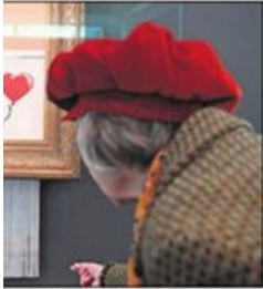
ber i fjor ble et kunstverk av r's for svimlende 10 millioner en falt forsvant plutselig bildet rte kunstverket.

ker», som ble plassert ut i Liverpools gater i nattens mulm og mørke - en variant av den klassiske statuen av «tenkeren» - en naken mann med hånden under haken som sitter og tenker. I Banksys utgave hadde tenkeren en trafikkjegle på hodet.