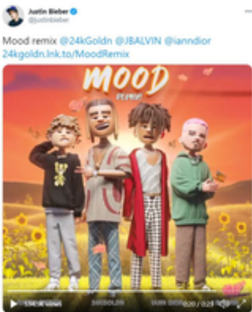
Coveret til remiksen av låten Mood, der blant annet

- Jeg har faktisk laget et cover til en låten Mood, som er en remiks som Justin Bieber og J Balvin var med på. Det virket som de var fornøyd, for begge har delt coveret på Instagram og Twitter, sier han.